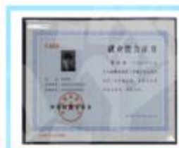
中国CAEP拓展培训师就业证书