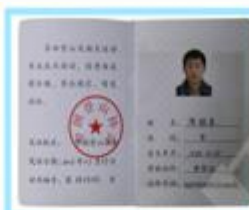
中国户外登山指导员证书