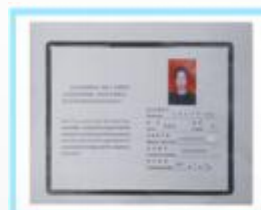
中国商务拓展培训师证书