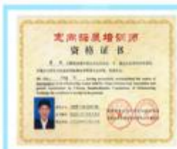
定向拓展培训师证书