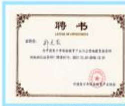
营地教育导师认证导师