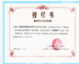
青少年成长导师项目教学基地授权书