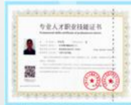
国家级营地教育导师(中级)