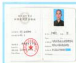
红十字会救护员证书