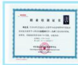
中国高级拓展培训师证书