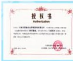
营地教育导师项目教学基地授权书